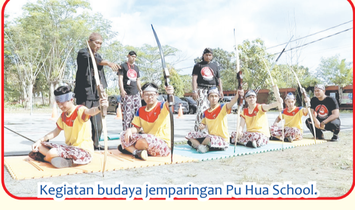
Kegiatan budaya jemparingan Pu Hua School.