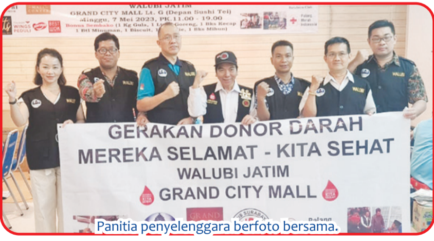
Panitia penyelenggara berfoto bersama.

Seluruh pendonor yang lolos mendonorkan darahnya diberikan paket sembako berisikan 1 kg gula pasir, 1 liter minyak goreng, 1 bungkus kecap, 1 botol minuman, 1 biskuit, 1 bungkus mie instan dan 1 bungkus bihun.