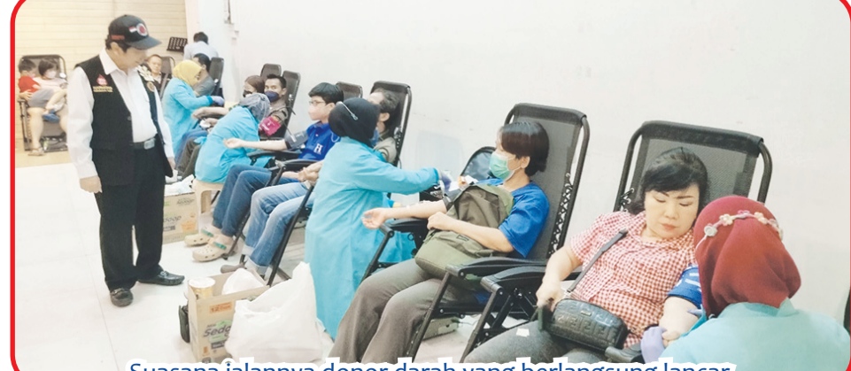
Suasana jalannya donor darah yang berlangsung lancar.