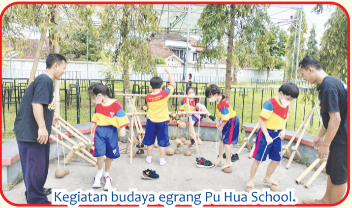
Kegiatan budaya egrang Pu Hua School.