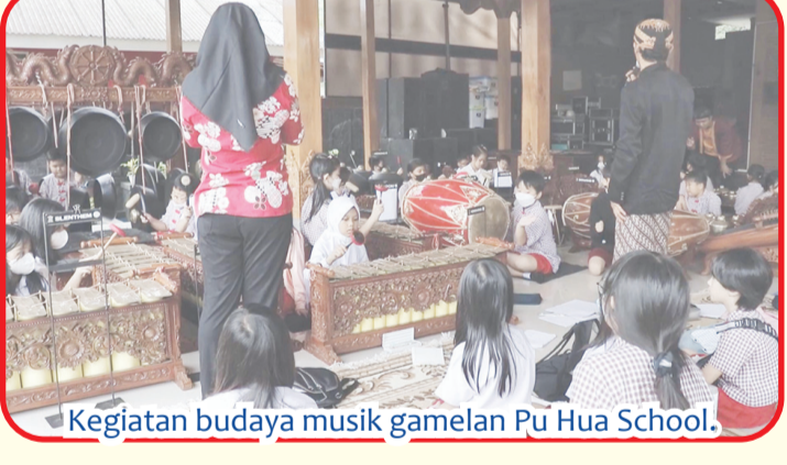
Kegiatan budaya musik gamelan Pu Hua School.