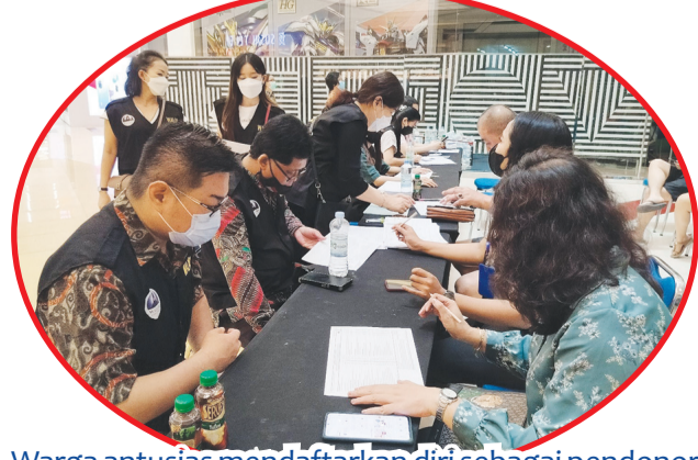
Warga antusias mendaftarkan diri sebagai pendonor darah.