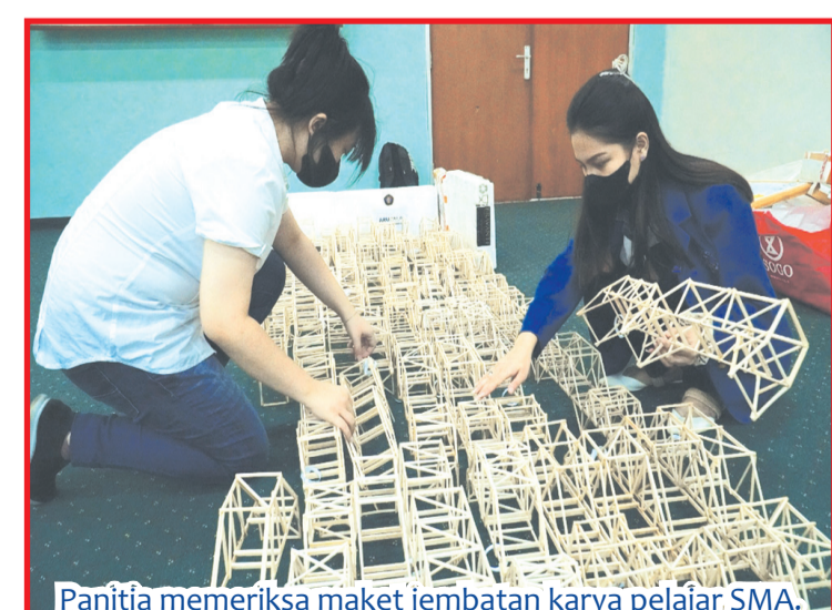
Panitia memeriksa maket jembatan karya pelajar SMA.

universitas di seluruh Indonesia, pesertanya mencapai 27 tim (3 orang tiap tim). Babak eliminasi Bridge Competition tingkat SMA dilaksanakan selama dua hari, Jumat, 5 Mei 2023 di Gedung T ruang AVT untuk level SMA dan Sabtu, 6 Mei 2023 untuk level universitas mulai pukul 09.00-17.00 WIB. Panjang maket jembatan tiap level memiliki syarat yang berbeda. Untuk level SMA panjangnya mencapai 400-450 mm dengan lebar 70-100 mm dan tinggi 150-250 mm. Pembebanannya pun dilakukan hanya dua titik saja dari tiga titik pembebanan yang ada. Total pembebanannya maksimal 35 kilogram. Sementara itu untuk level universitas maka panjangnya 500-550 mm, dengan lebar 80-100 mm dan