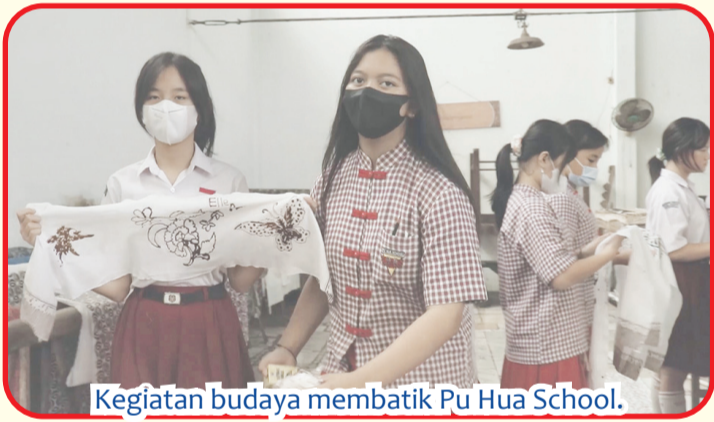
Kegiatan budaya membatik Pu Hua School.