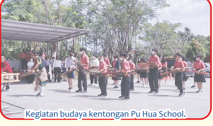
Kegiatan budaya kentongan Pu Hua School.