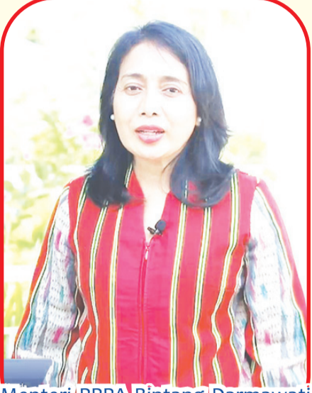
Menteri PPPA Bintang Darmawati mengucapkan selamat ulang tahun kepada Pu Hua School.