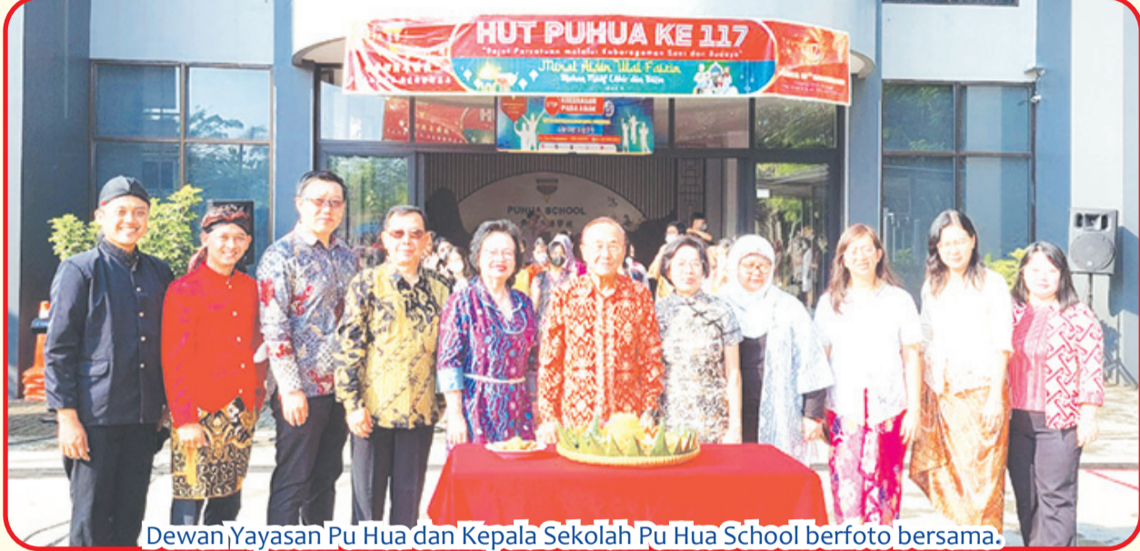
Dewan Yayasan Pu Hua dan Kepala Sekolah Pu Hua School berfoto bersama.