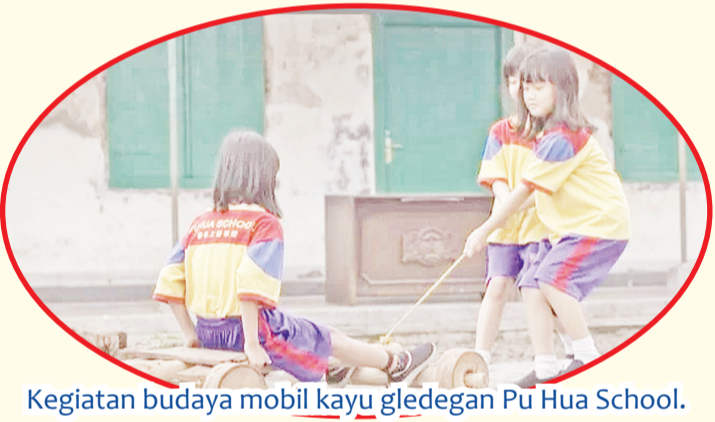
Kegiatan budaya mobil kayu gledengan Pu Hua School.