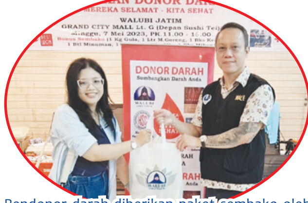
Pendonor darah diberikan paket sembako oleh panitia.